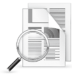
西店镇人民政府内设机构及下属事业单位情况表

(二) 优化配置机构编制资源。一是科学设置内设机构。按照精简效能和保障重点原则,除了党政办公室等几个必设机构,其他机构可以按照经济发达镇的发展特色和工作重点,适当突破9个内设机构总数的限制,因地制宜进行整合设置。二是优化配置事业单位。对职能重叠、相近的事业单位进行整合,优化组织架构。如依托西店镇万事达金融商务中心,完善集行政审批、社会管理服务、公共资源交易等功能为一体的综合办事服务大厅建设,全面深化“互联网+政务服务”工作,切实提升政务服务水平。